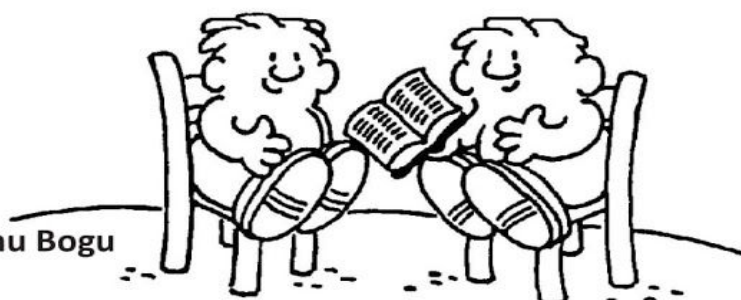
Rozmawiając o Panu Bogu