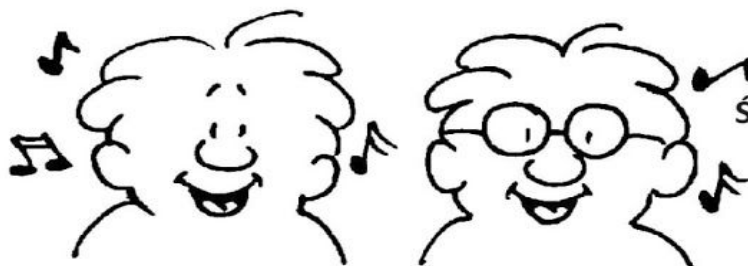
Śpiewając dla Pana