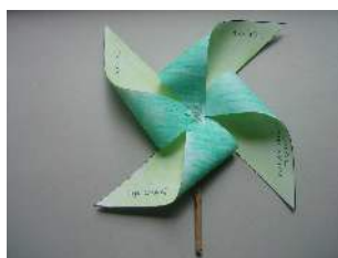
Zdjęcie gotowych prac