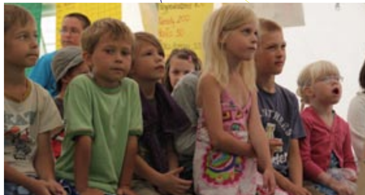
Tydzień Ewangelizacyjny w Mrągowie