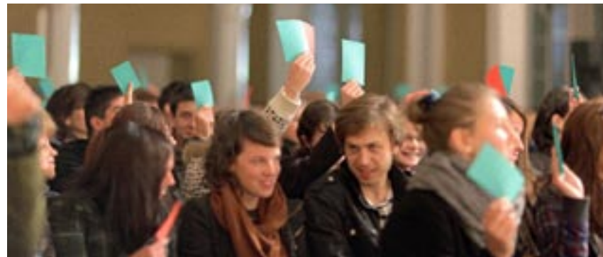
Noc z Lutrem