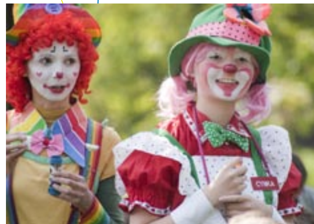
Występ klaunów w czasie Dnia Godności Osób z Niepełnosprawnością Intelektualną w Świętochłowicach