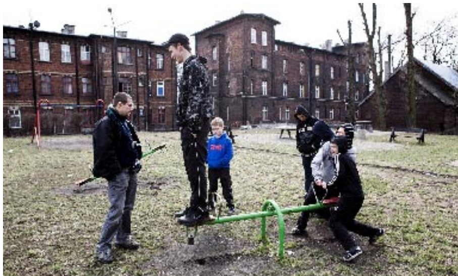
Pedagog ulicy z podopiecznymi

W luterzańskim programie radiowym „Po prostu”, nadawanym codziennie