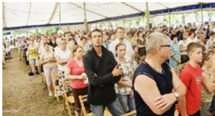
Tydzień Ewangelizacyjny w Dzięgielowie

W wakacje zakończyliśmy trzyletni cykl szkolenia dla Pomocników i Pracowników wśród Dzieci . Szkolenie ukończyło 11 osób.