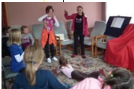
Rekolekcje pasyjne w Karpaczu