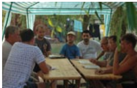
Zajęcia z Biblią na wczasach dla rodzin

W 2011 roku indywidualni odbiorcy naszych działań, to 17 629 osób, a 40 652 to wszyscy ich uczestnicy.