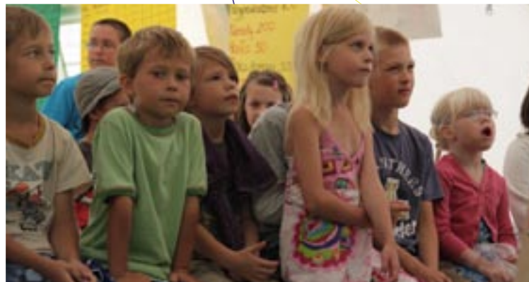
Tydzień Ewangelizacyjny w Mrągowie