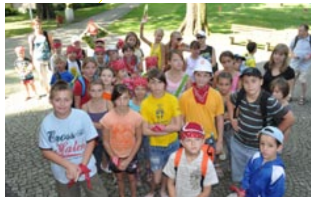
Obóz dla dzieci

Ludzie to Boża metoda Dla poprawy jakości życia