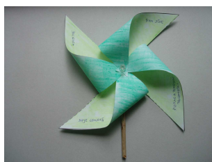
Zdjęcie gotowych prac