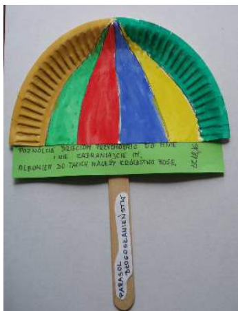
Rys. nr 2