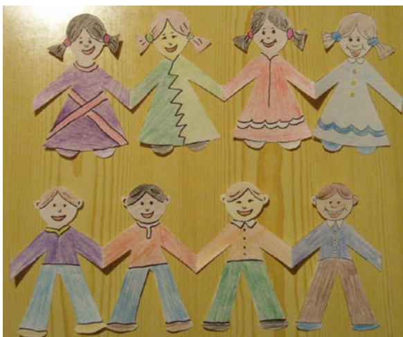
Zdjęcie gotowej pracy